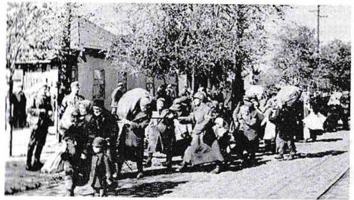
La drum.

când aproximativ 44.000 de persoane 26 , care locuiau pe o rază între 25-35 de km de la granița cu Jugoslavia, au fost deportate în Bărăgan într-una din cele mai secrete, rapide și represive acțiuni organizate de autoritățile comuniste. Germani, bulgari, sârbi, evrei, români bănățeni și olteni, basarabeni, bucovineni, aromâni, vlahi, megleno-români etc. au fost deportați din zona lor de origine sau de „dislocare” 27 în plin câmp, unde au fost obligați să își construiască, pornind de la zero, o nouă viață.